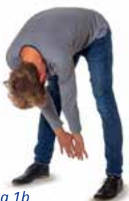
Übung 1b Dehnung der Körperrückseite

Richten Sie Ihren Oberkörper auf und strecken Sie beide Arme nach hinten über den Kopf.