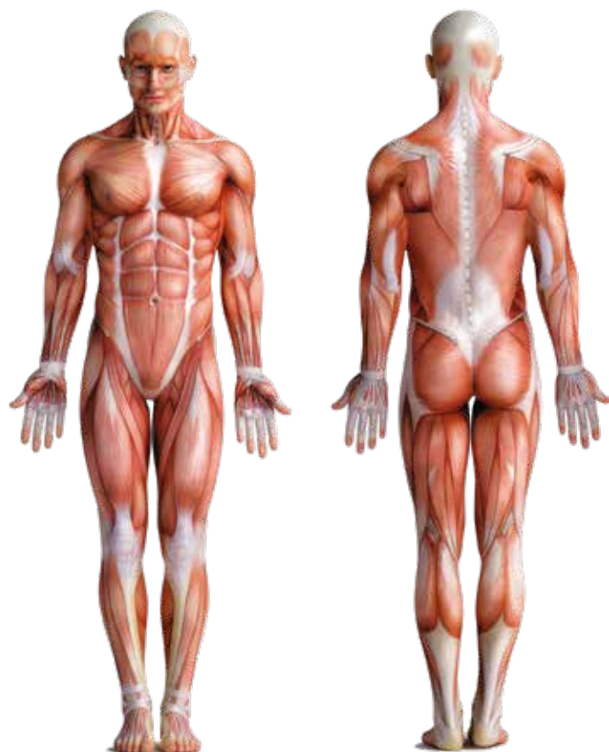
Die weißen Strukturen stellen die Faszien dar.