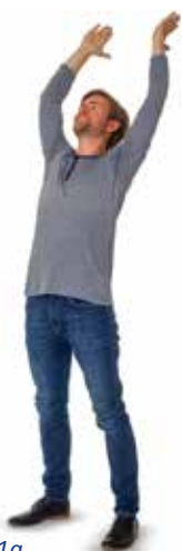
Übung 1a Dehnung der Körpervorderseite

Diese drei Basisübungen dehnen Ihre wichtigsten Faszien. Führen Sie jede Übung jeweils mit 20 kleinen (circa 2 Zentimeter), sanften Minifederungen in den Endstellungen durch.