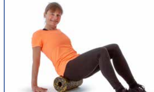
Übung 4 – Rollen Sie über Ihr Gesäß.

Rollen Sie über die Außenseite der Oberschenkel.