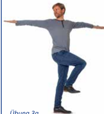
Übung 3a Dehnung der Rumpfmuskulatur

Stellen Sie das rechte Bein hinter Ihren Körper und strecken Sie den rechten Arm über den Kopf nach links.