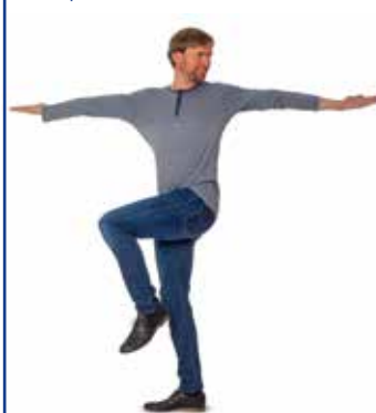
Übung 3b Dehnung der Rumpfmuskulatur

Heben Sie Ihr rechtes Knie an und drehen Sie mit ausgestreckten Armen den Oberkörper nach rechts.